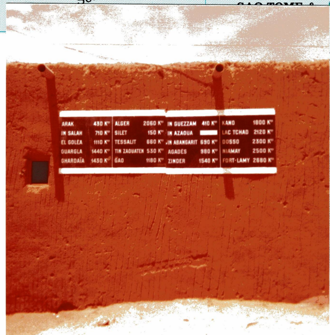
ENTFERNUNGSTAFEL IN TAMANRASSET (ALGER.)